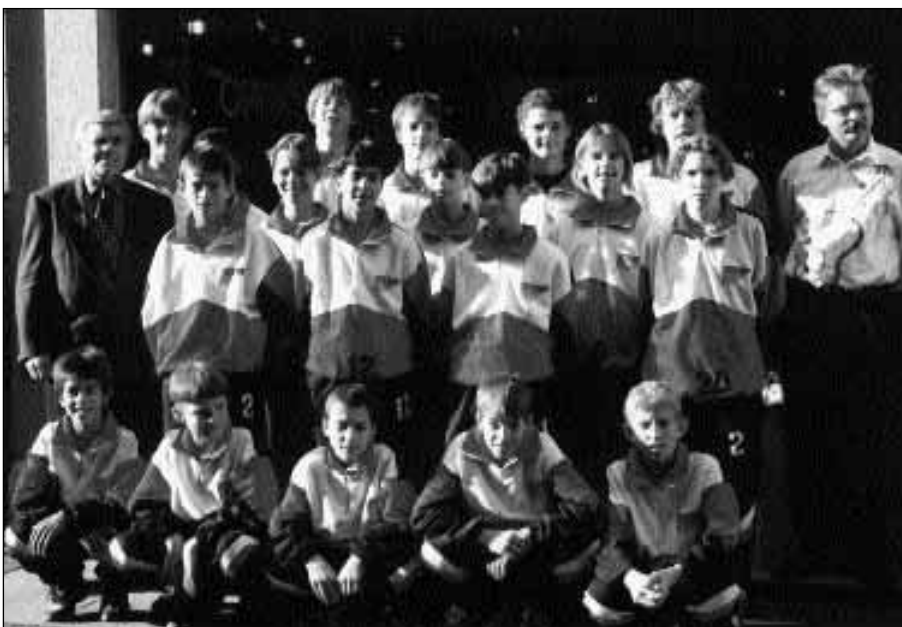
Stellvertretend für alle FCS Junioren posierte die Inter-C-Mannschaft vor dem Geschäft des grosszügigen Sponsors (rechts aussen stehend).

Der Verein und seine Juniorenbewegung tun mit dieser Aktivität etwas füreinander und sind miteinander zufrieden