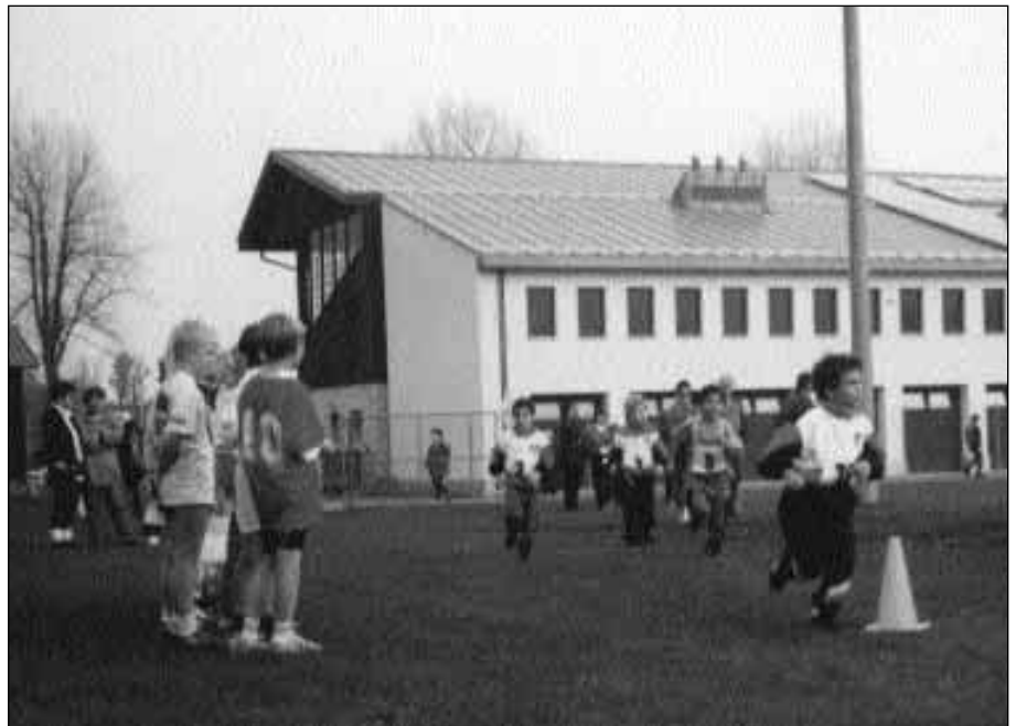
Die Kleinsten ganz gross unterwegs.